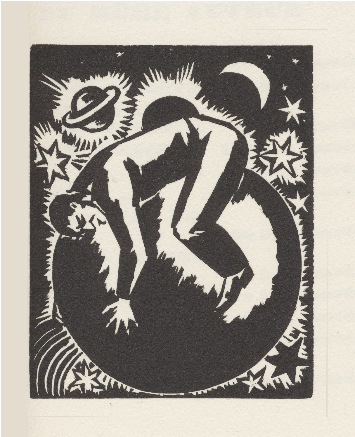
Slot van de beeldroman L'Oeuvre (1928) van Frans Masereel