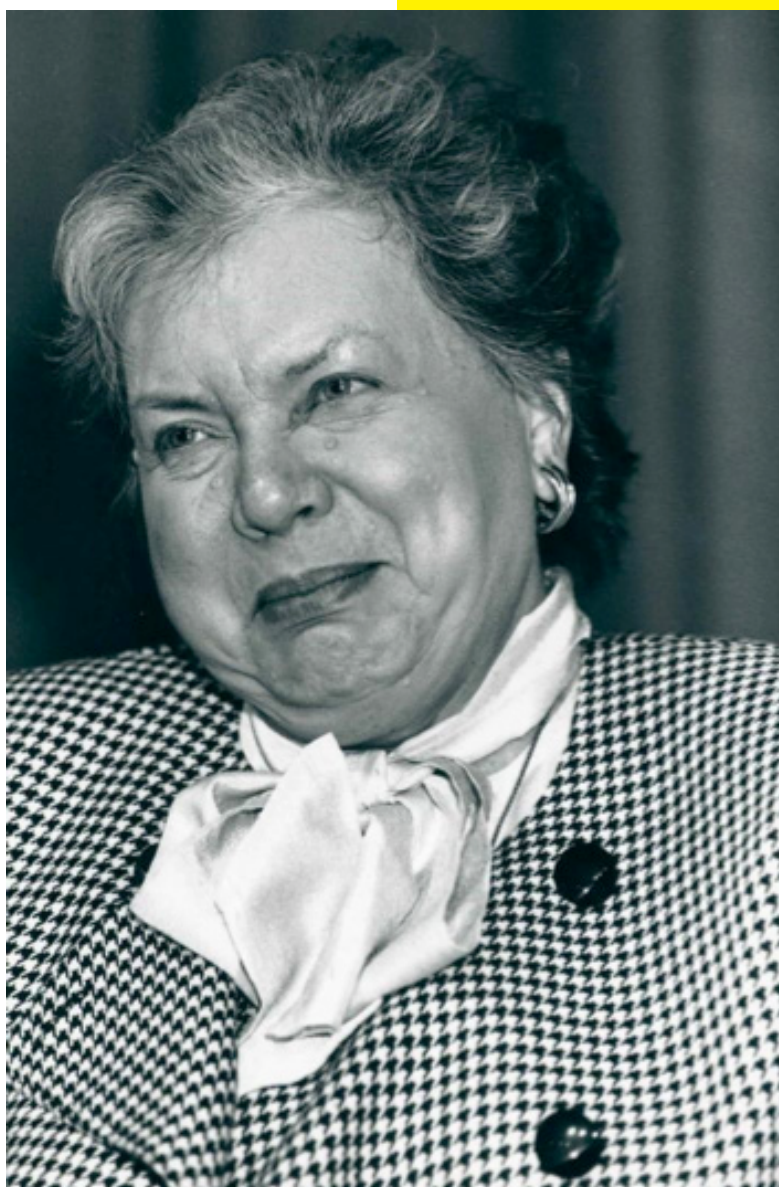
Senator Lucienne Herman-Michielsens, 1989