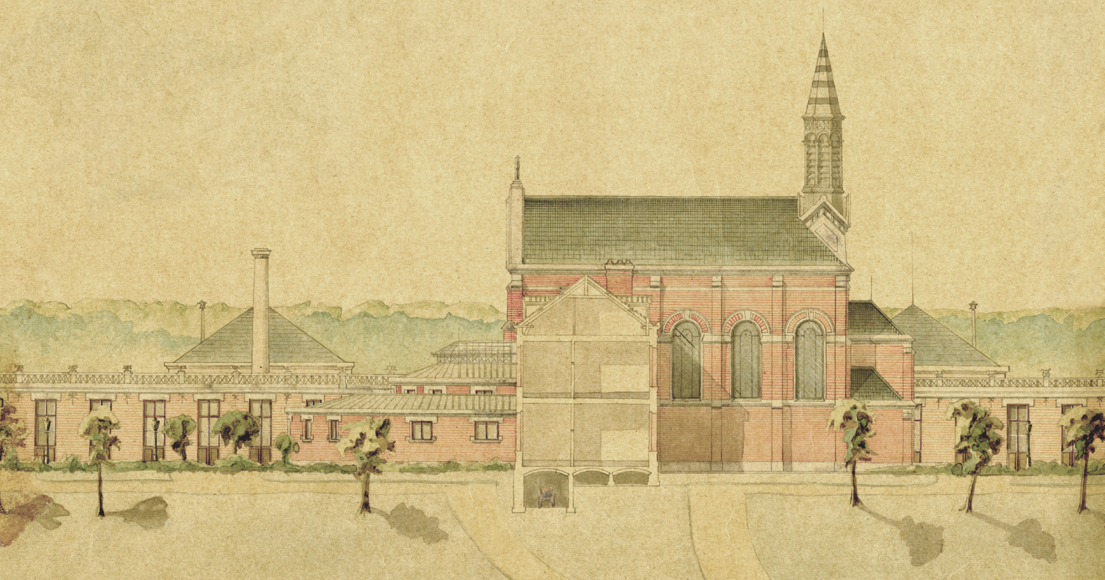
François Baeckelmans, voorontwerp van het Stuivenbergziekenhuis te Antwerpen, jaren 1870

In 2019 en 2020 zet het VAI in op de registratie van de oudste archieven uit de col- lectie. De archieven van Engetrim , De Beer en Baeckelmans worden ge- reinigd, verwerkt en her- verpakt. Tegelijk zullen de meest waardevolle teke- ningen uit deze archieven gedigitaliseerd en online gepubliceerd worden.