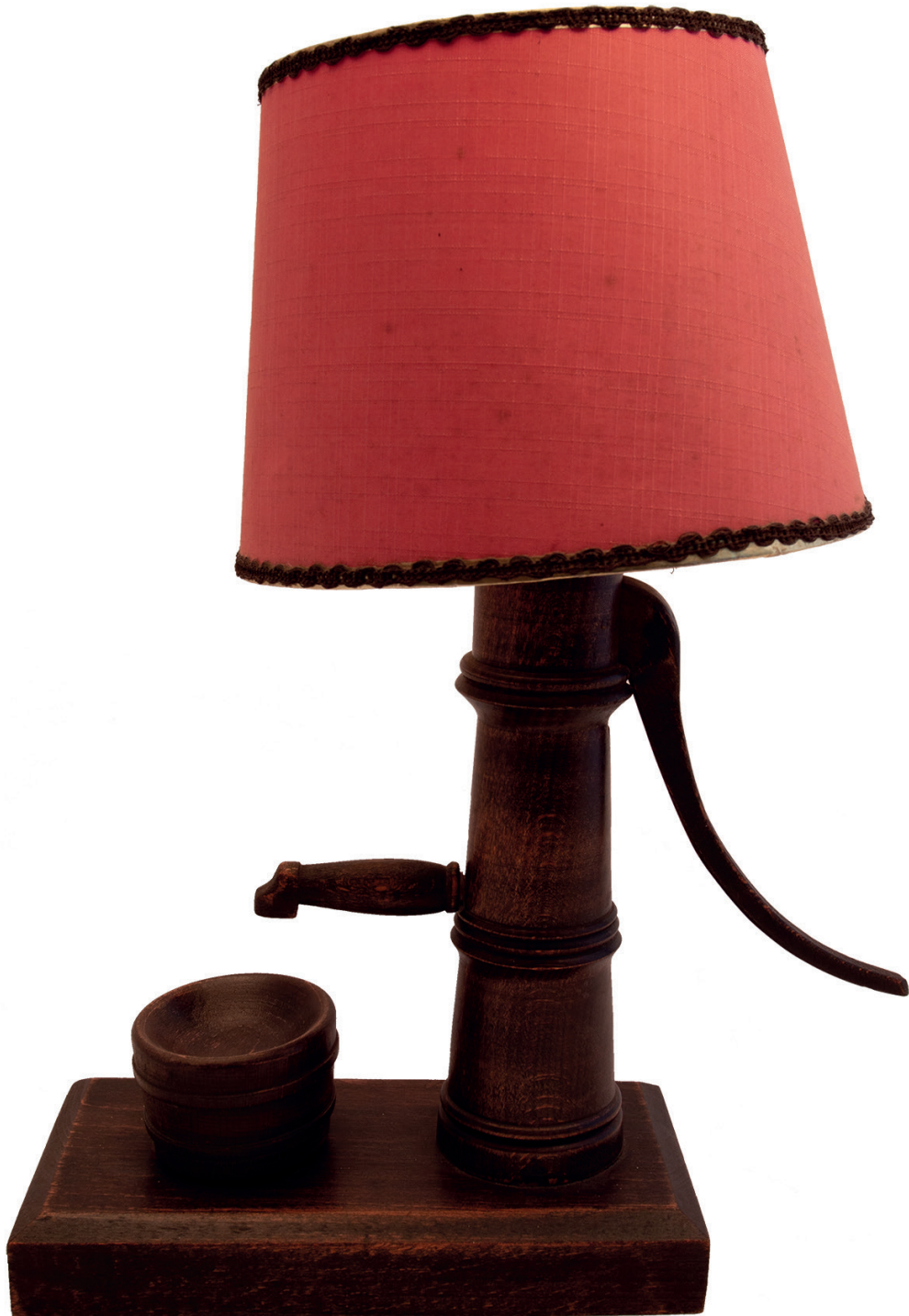
Een lamp vervaardigd in Merksplas rond 1950, met een opvallend waterpomp motief, waarbij de pomp fungeerde als de aan- en uitschakelaar