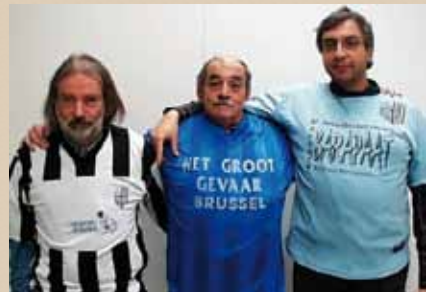
De voetbalploeg van het AMVB in de truitjes van Zaalvoetbalclub Het Groot Gevaar Brussel

Tot slot van dit overzicht wordt afgesloten met een van de weinige sportarchieven in het AMVB: Zaalvoetbalclub Het Gevaar. Het bestand werd geschonken door Sven Gatz. Het archief is reeds mooi chronologisch geordend en bevat subsidieaanvragen, wedstrijduitslagen, briefwisseling, foto's en de voetbaltruitjes van 1992 tot 2008. Een tweede bestand dat hij overdroeg betreft de Raad van Bestuur van Jeugd en Stad. Deze vzw werd in 1984 opgericht als ondersteunende organisatie voor het Nederlandstalige jeugdwerk in het Brussels Hoofdstedelijk Gewest. 3 Het versterken van het vrijetijdsaanbod via ondersteuning van jeugdhuizen, jeugdbewegingen, jeugdateliers en speelplein was een van de eerste doelstellingen. Later breidde dit ook uit naar tewerkstelling van jongeren en straathoekwerking. Uiteindelijk groeide JES uit tot een organisatie die ook in Antwerpen en Gent actief is op vele terreinen die de jeugd aanbelangen.