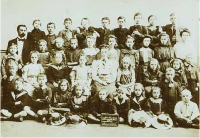
De leerlingen van de Nederlandse Christelijke School te Brussel, 1910

vergissingen, vooroordelen en superstities van Rome af te zweren! 16 De materiële problemen nemen naarmate de tijd verstrijkt echter alleen maar toe: de banken vragen om onderhoud, het lokaal regent op meerdere plaatsen in en er is dringend een verbouwing nodig. Echter het geld daartoe ontbreekt. Men gaat op zoek naar een alternatief lokaal, maar dat komt er pas op 29 januari 1861, als men een nieuw gebouw in de Blaesstraat in gebruik neemt. 17