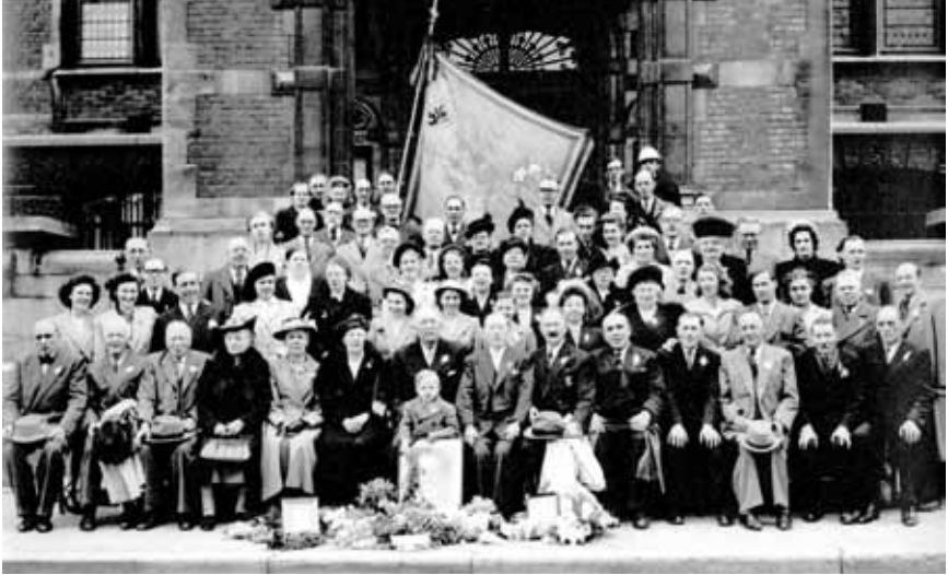
De Violier Jette bij hun 40-jarig bestaan

van koning auto en de ingrijpende veranderingen die de stad onderging. Waar dat het autobezit vrij lang voorbehouden was voor de gegoede klasse en vooral als statussymbool werd aanzien, kende België en zeker de Brusselse agglomeratie sinds de jaren '50 van de vorige eeuw een toename van autobezitters. De auto bekleedt nu een zeer centrale plaats in onze samenleving. Het artikel is alleszins niet bedoeld als historisch overzicht. De aandacht werd vooral getrokken door de verwijzing naar Expo '58. De toekomstvragen die de auteur stelt, kunnen binnen 50 jaar geëvalueerd worden. Deze bijdrage kan dan ook als een tijdsdocument worden beschouwd. Het is echter doodjammer dat een aantal 'mobiele' aspecten van de laatste jaren niet in beschouwing werden genomen. Enerzijds is er de toename van het aantal fietsers in Brussel. Anderzijds bestaat het systeem van autodelen (Cambio) dit najaar 5 jaar. Cambio startte in 2003 met 4 standplaatsen (met 15 wagens) in Brussel en telt er vandaag 42 (met 126 wagens) in 17 van de 19 gemeenten. M.i. een gemiste kans. De auteur pleit immers voor reflectie waarin de