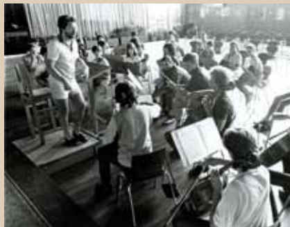
Zomerkamp van het internationaal Wereldorkest van Jeugd en Muziek te Oostmalle, 1981

In België werd de beweging geleidelijk uitgebouwd via de oprichting van plaat-