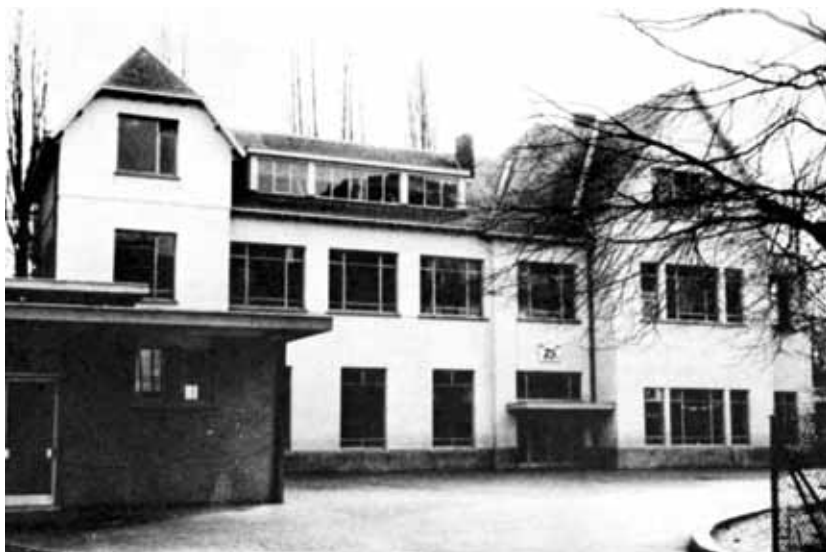
De Prinses Julianaschool te Etterbeek