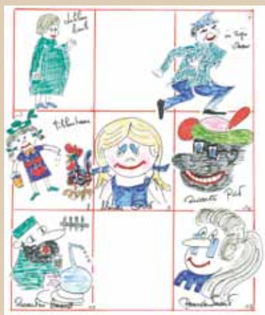
Het album van Lenterik werd eveneens opgesmukt met tekeningen (Archief van Volksdansgroep Lenterik)

J&M staat open voor alle jongeren, met of zonder muzikale 'voorkennis'. Het begrip goede muziek van Cuvelier werd verruimd naar kwaliteitsmuziek waardoor niet alleen de strikt klassieke muziek aan bod komt, maar een hele reeks van muziektradities en muziekgenres.