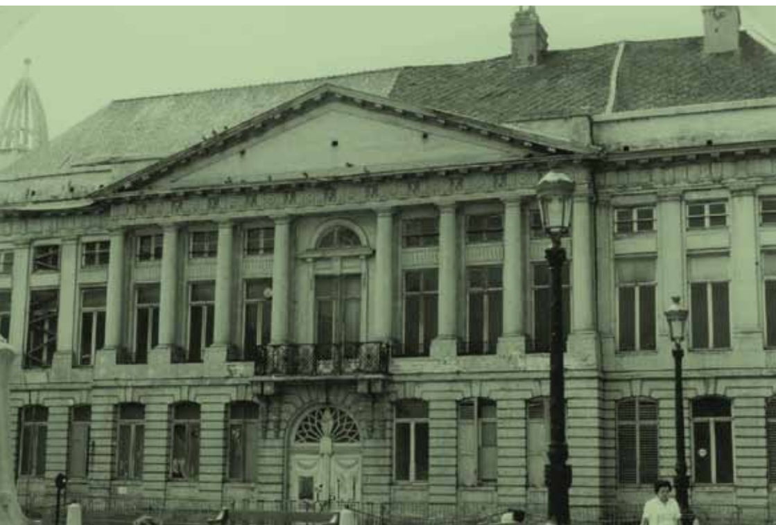
Het gebouw dat men in gedachte had voor de CCC, is vandaag het kabinet van Minister-president Peeters (BE AMVB VERZ 17)

Het gebouw op het Martelaarsplein 23 werd op 30 maart 1971 plechtig ingehuldigd als het Contact- en Cultuurcentrum. De promotoren van het centrum waren allen aanwezig. De plaat die ter herdenking werd aangebracht in de hal gaf duidelijk aan dat die opening maar een eerste stap was. De tekst begon met: 'Op 30 maart 1971 werd de eerste kern van het Contact- en Cultuurcentrum plechtig geopend...'. Er werd dus duidelijk gerekend op een verdere uitbouw van het centrum. 21