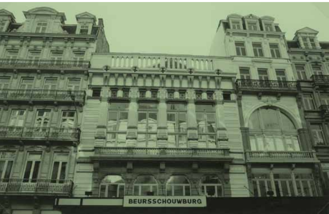
Beursschouwburg