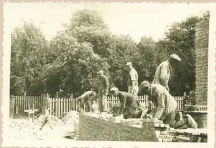
De bouw van een nieuwe vleugel voor het Heilig Hartcollege, 1942