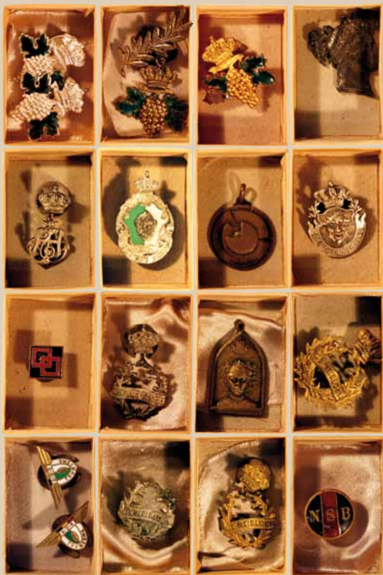
Sierspelden van Brusselse toneelgezelschappen