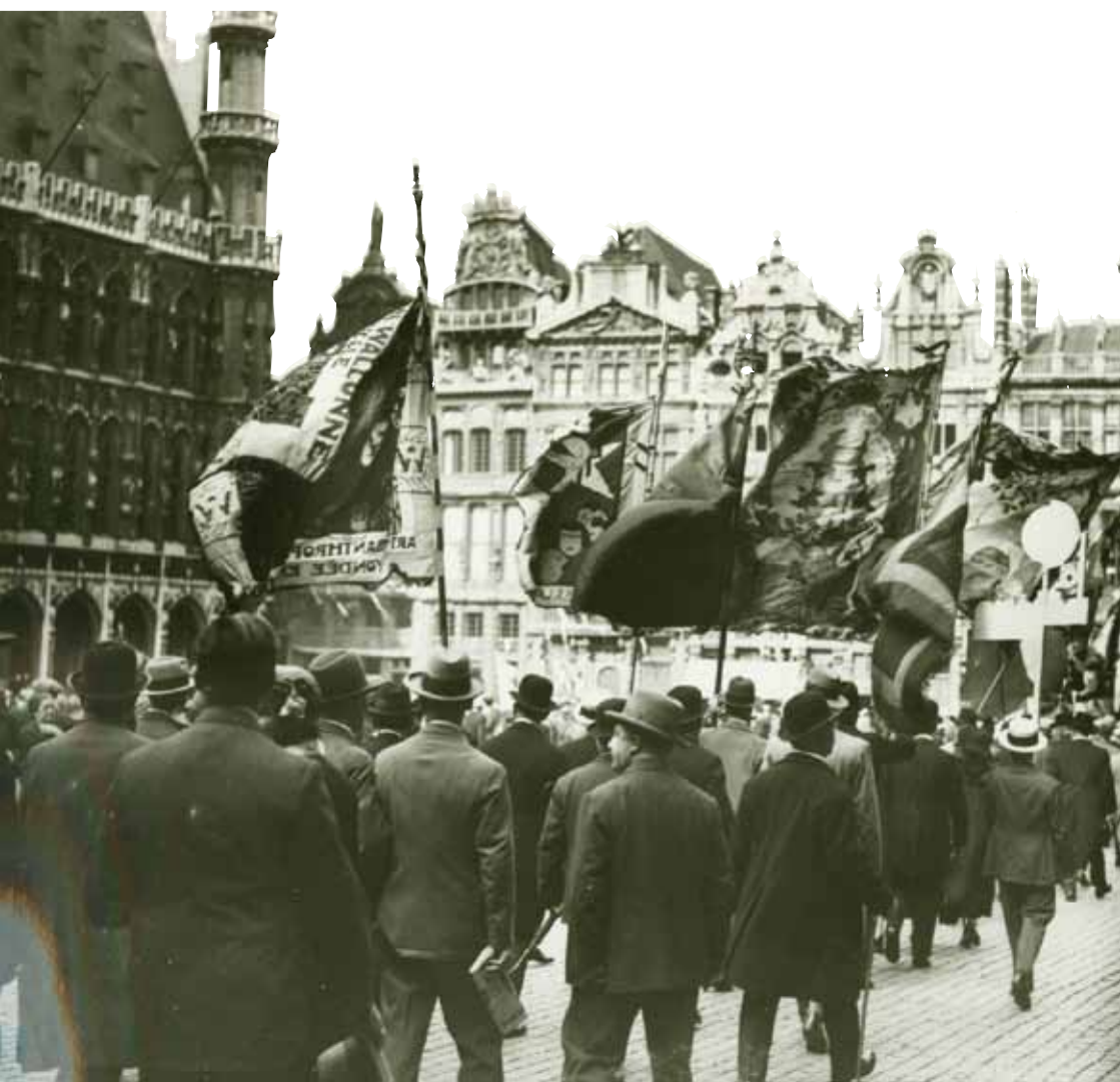
Aankomst van de optocht ter gelegenheid van 275 jaar De Wijngaard op de Grote Markt, 1932